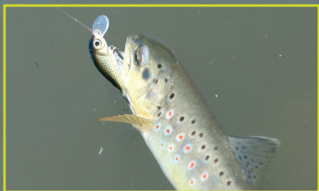
Tento potočák sa ulakomil na 4 cm Snipera.