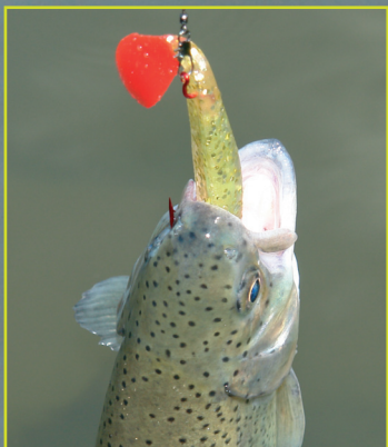
Joker Lure v akcii.