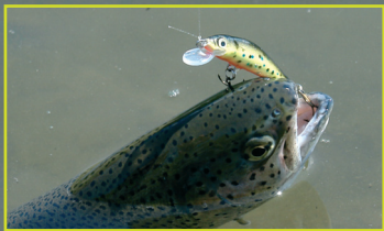
Aj 4 cm štíhly Ablet bol úspešný.