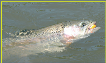
Veľký duháč ulovený na 3 cm plávajúci Humpy.