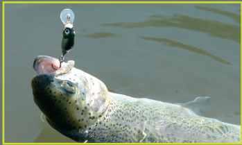
Ryby dobre reagovali aj na 2 cm potápavý model Humpy.

Je to už dosť dávno, čo som prepadol lovu prívlačou a dovoľm si tvrdiť, že som za tú dobu vyskúšal naozaj veľké množstvo umelých nástrah. Boli medzi nimi fantasticky úspešné, ale aj také, na ktoré sa mi príliš nedarilo. No moja minulé prívlačová sezóna bola najslabšia, akú si za svoju rybársku prax pamätám.